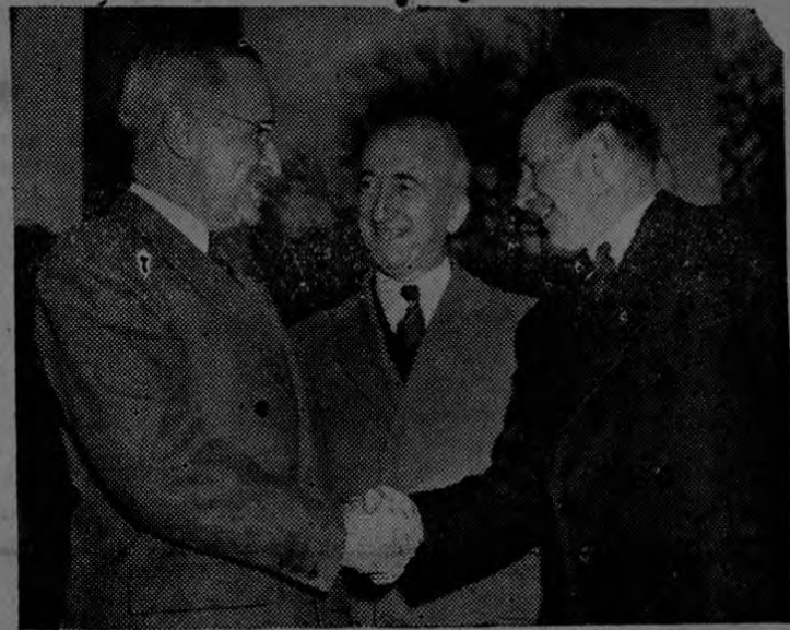
El Presidente Harry S. Truman, saludando a Clément R. Attlee, primer ministro de la Gran Bretaña (derecha) en presencia de James F. Byrnes, secretario de estado de los Estados Unidos (centro). Mr. Attlee vino a Washington acompañado por Mackenzie King, primer ministro de Canadá, con el fin de conferenciar acerca de importantes problemas mundiales.