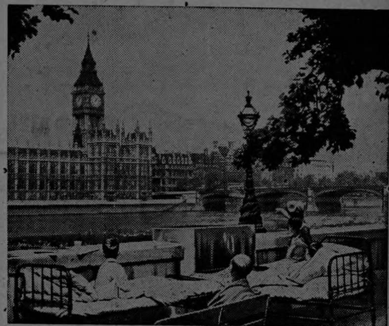
Los pacientes desde uno de los balcones del Hospital Santo Tomás en Londres se recrean mirando el Big Ben a través del Río Támesis.

WASHINGTON. — Los promedios de mortalidad infantil y materna en los Estados Unidos durante 1944 fueron los más bajos que jamás se hayan registrado, a pesar de la escasez de personal médico y de la falta de hospitales, causados por la guerra. La mortalidad ma-